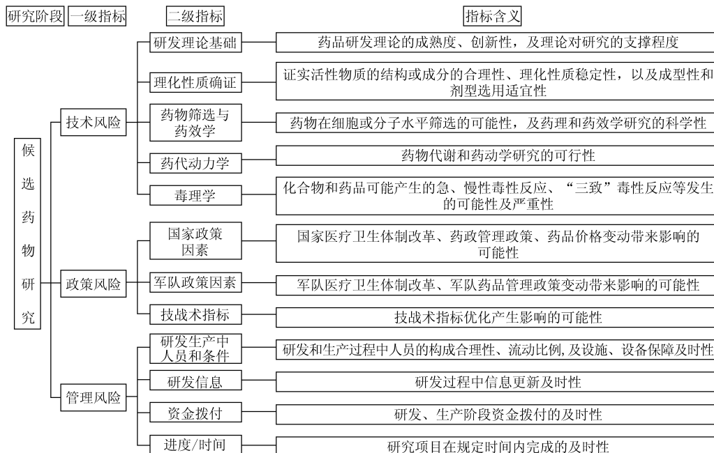
图2 药物候选阶段的新药研发项目风险评估指标体系

完成的影响程度是不一致的,而且各指标的权重分配也不同。因此,研究风险时必须从动态的角度进行考虑,在构建过程中,综合研发项目的阶段特征,将风险评估指标体系细分,指标体系的构成和具体指标的内涵见图2~4。