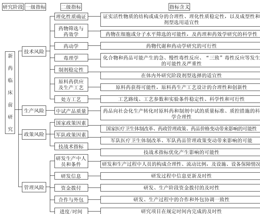
图3 药物临床前阶段的新药研发项目风险评估指标体系